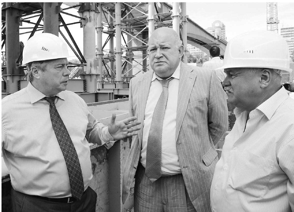
● Скорректированы сроки строительства мостов и дорог, ведущих к мега-стадиону

– Нужно понимать уже сейчас, как будут использоваться объекты инфраструктуры, – подчеркивает Василий Голубев, – какую роль они сыграют в комплексном развитии левобережной зоны Ростова, всей Ростовской области, какую пользу жителям области смогут принести стадион, гостиницы, спортивные объекты.